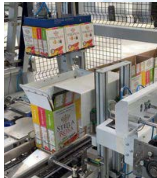
PICK & PLACE E MANIPOLATORI