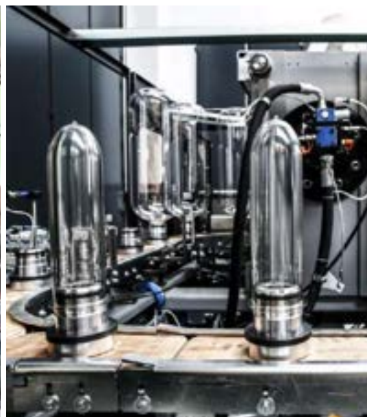
SOFFIATRICE PER FORMATI DI GRANDI DIMENSIONI