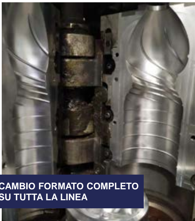
CAMBIO FORMATO COMPLETO SU TUTTA LA LINEA