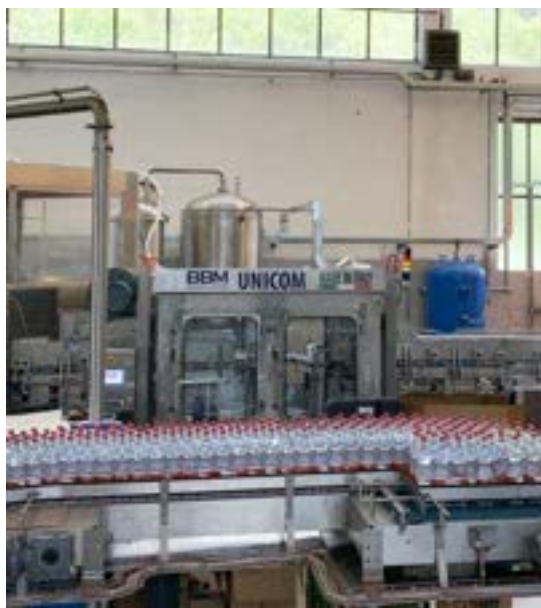
COMBINATORE UNIVERSALE SOFFIATRICE - RIEMPITRICE

Ecco alcuni dei macchinari costruiti dal nostro ufficio tecnico, pronti ad essere implementati