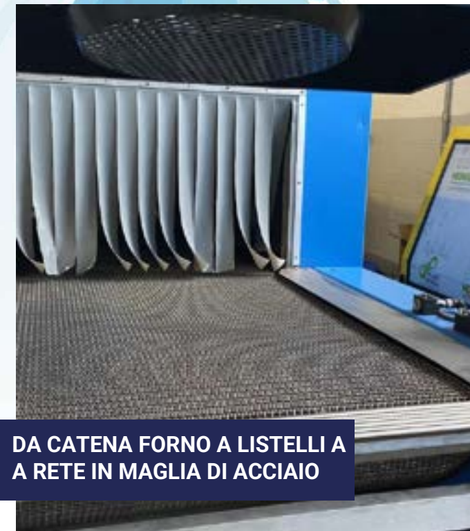
DA CATENA FORNO A LISTELLI A A RETE IN MAGLIA DI ACCIAIO